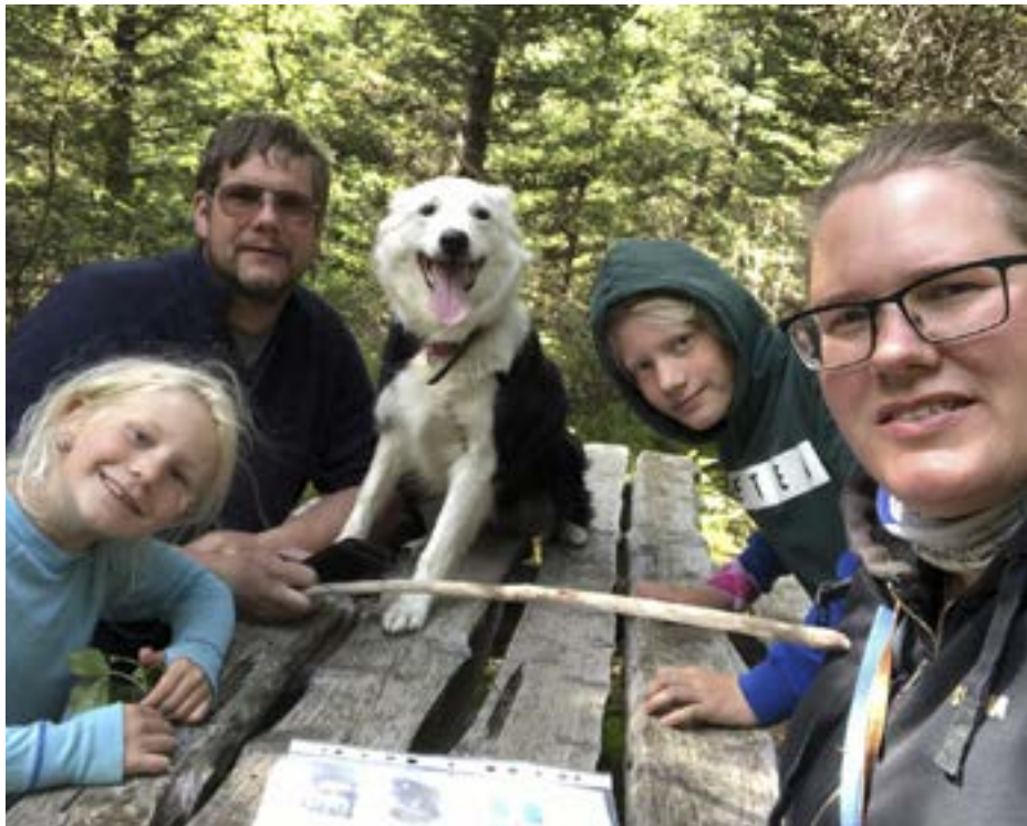
Ferfætti fjölskyldumeðlimurinn Gola í góðu yfirlæti.

Samkomubannið síðasta vor var mjög skrítið og krefjandi tímabil fyrir okkur, eins og fyrir alla aðra. Allt í einu þurftum við að færa kennslu yfir á netið og læra á nýja tækni. Börnin kunnu ekki á þessa tækni svo við þurftum að kenna þeim jafnóðum og við lærðum sjálf. Vera einu skrefi á undan þeim. Fyrir páska mætti starfsfólkið alla daga, en nemendum var skipt upp í tvo hópa sem skiptust á að mæta í skólann. Þessir tveir hópar máttu ekki hitta aðra utan síns hóps, líka utan skóla, svo þau voru mörg sem hittu ekki vini sína í marga vikur. Sum mættu ekki í skólann því þau bjuggu í sama húsi og afar þeirra og ömmur, sem máttu ekki smitast. Svo eftir páskafríið var starfsfólkinu líka skipt upp, svo allt í einu var ég heima 2-3 daga í viku og hitti bara helming skólans. Mér finnst