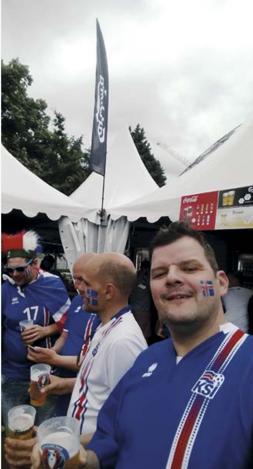
Benni að styðja íslenska landsliðið.

— Höfundur: Þórður Örn Kristjánsson. —