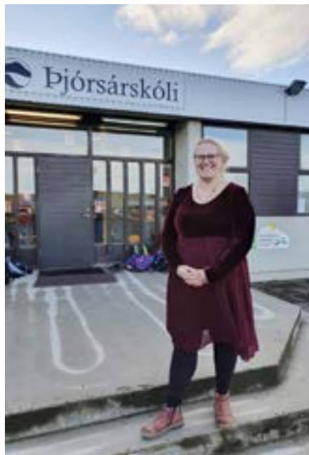
Selma á sínum vinnustað.

Já, heilmikill munur. Sameiginlegt: Báðir