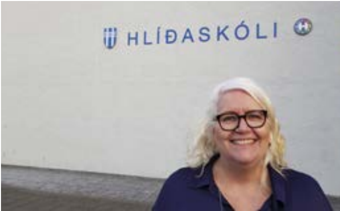
Nýr skólastjóri Hlíðaskóla.

Pú ert náttúrulega reynslumikil á þessu sviði og varst áður skólastjóri Vesturhlíðarskóla. Er mikill munur að vera skólastjóri með eingöngu döff nemendum og í Hlíðaskóla þar sem flestir nemar og kennarar eru heyrandi?