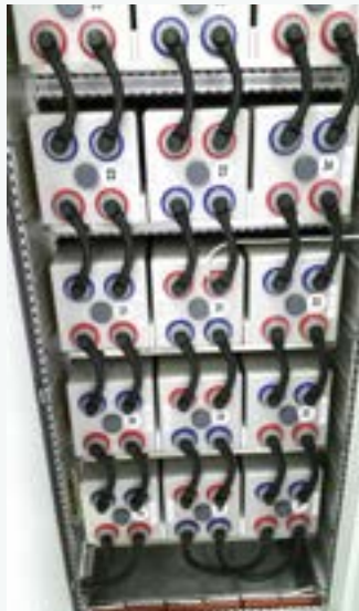
Nóg af hlutum sem þarf að kunna deili á.

hið heilaga gral sem Englandsmeistaratitillinn er en auðvitað hefur klúbburinn gefið manni margar ánægjustundir þessi 30 ár sem hann náði ekki að vera Englandsmeistari. Unnið á meðan stóra titla, til dæmis meistaradeild Evrópu sem er sá helsti í heiminum.