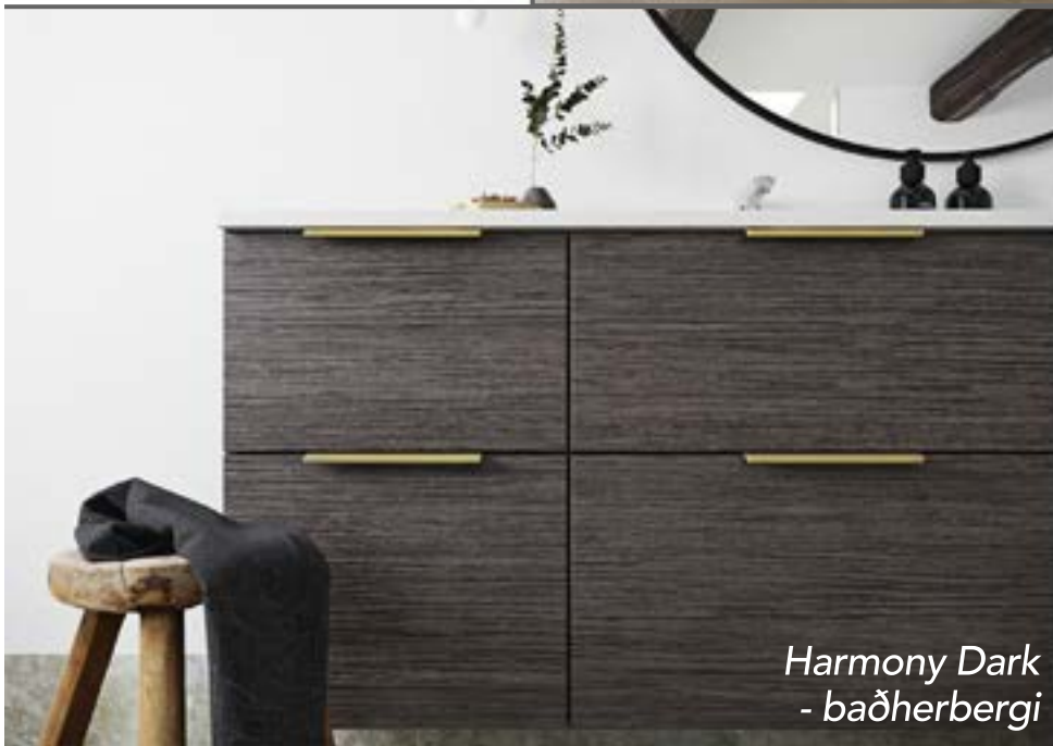
Harmony Dark - baðherbergi

Ævintýrið byrjar á heimsókn í glæsilegan sýningarsal okkar í Lágmúla 8, 2. hæð, þar sem allar helstu nýjungar eru til sýnis.