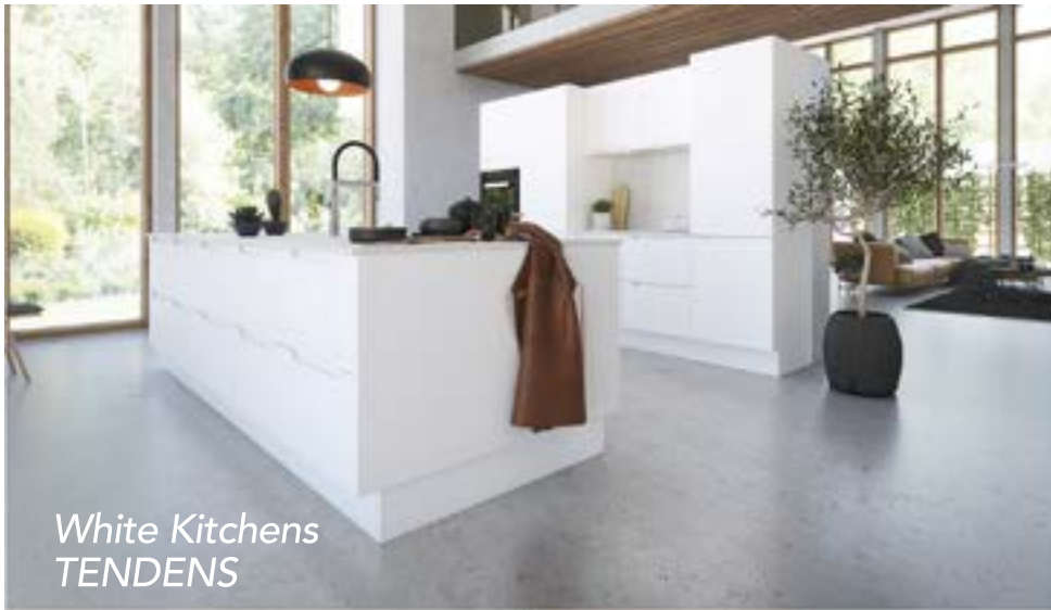
White Kitchens TENDENS