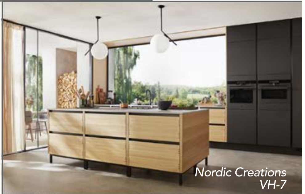
Nordic Creations VH-7

Nútíma lífstíll kallar á kröfur. Á sama hátt og við höfum væntingar til lífsins, gerum við kröfur til heimilisins okkar. Komdu til okkar, lýstu óskum þínum og leyfðu okkur að teikna innréttingar sem henta þínu heimili.