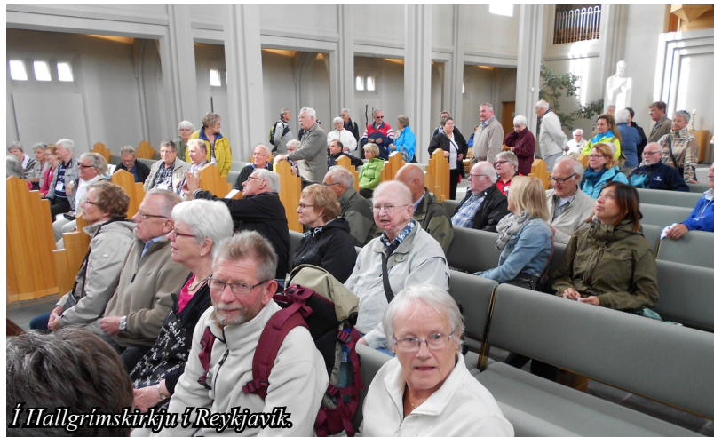
Í Hallgrímskirkju í Reykjavík.