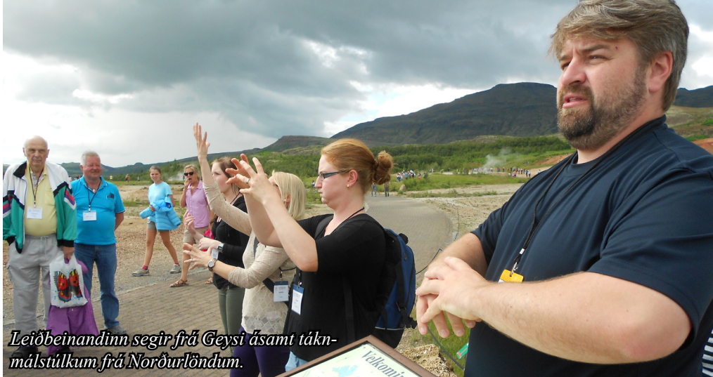
Leiðbeinandinn segir frá Geysi ásamt tákn- málstúlkum frá Norðurlöndum.

Takk fyrir frábært mót. Hittumst í Noregi 2015.