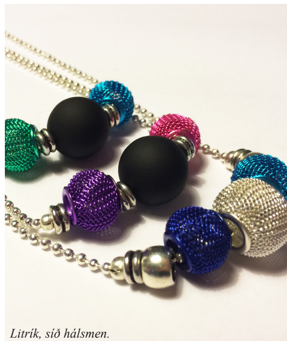
Litrik, síð hálsmen.