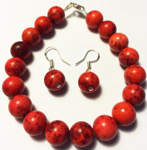
Eyrnarlokkar og armband úr rauðum steinum