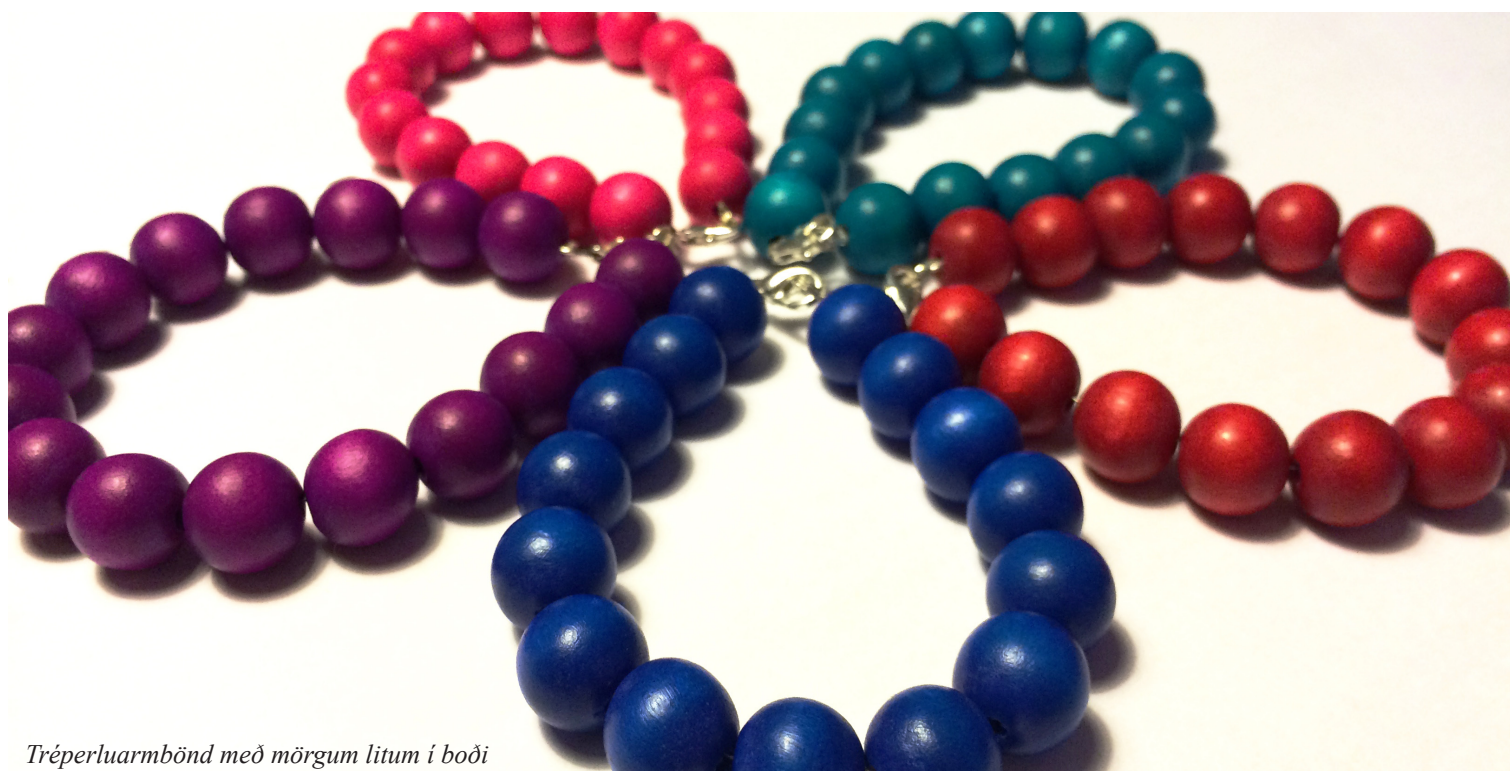
Tréperluarmbönd með mörgum litum í boði