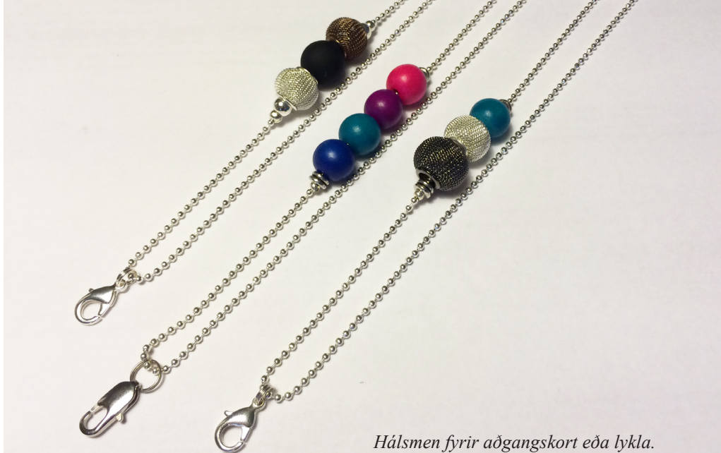
Hálsmen fyrir aðgangskort eða lykla.

Hægt er að nálgast Lisu Design á Facebook, www.facebook.com/lisa.design.iceland