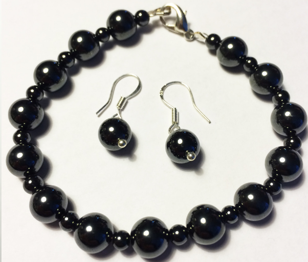
Blóðsteins eyrnarlokkar og armbönd.