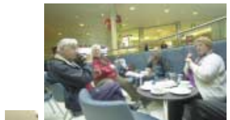
Frá félagsstarfi aldraðra