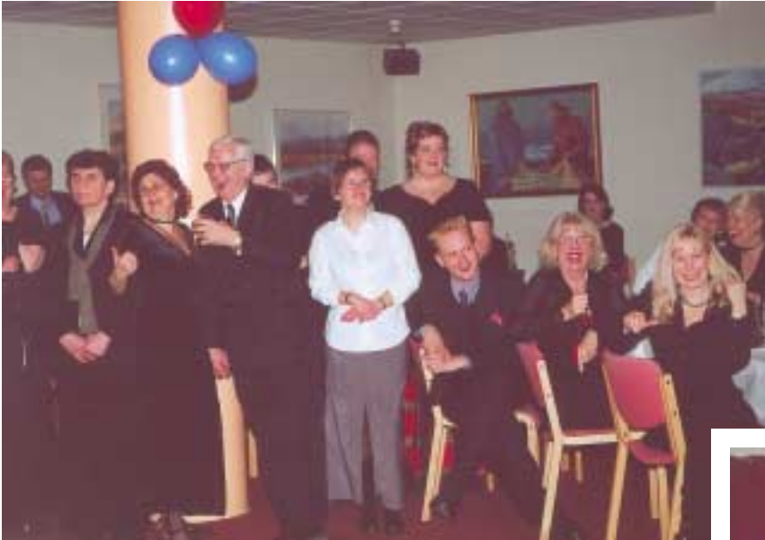
Skemmtiatriðin vöktu mikla kátínu að vanda.

Meðfylgjandi eru nokkrar myndir frá árshátíðinni.