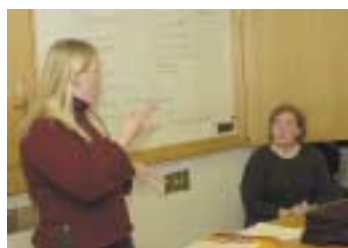
Frá stofnun Puttalinga