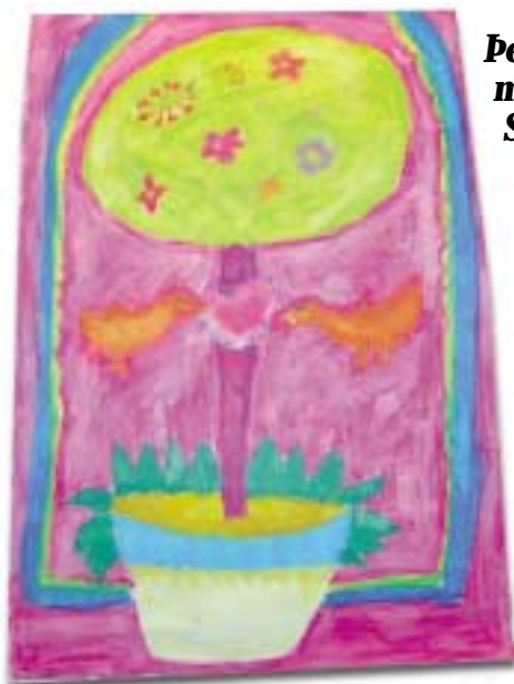
Þessa skemmtilegu mynd málaði Sunna Dögg Scheving