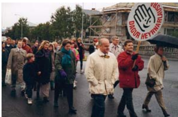
(Mynd: Frá Degi heyrnarlausra 1995)

Samfélag heyrnarlausra stóð á þröskuldi á þessum síðasta áratug 20. aldarinnar. Lög um Samskiptamiðstöð heyrnarlausra og heyrnarskertra voru samþykkt og Samskiptamiðstöð tók til starfa. Heyrnarlausir höfðu nú greiðan aðgang að tulkum og ættingjar þeirra að táknmálsnámskeiðum, auk þess sem hið heyrandi samfélag var smám saman að