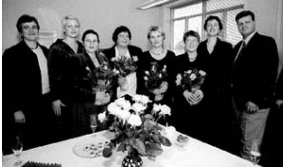
(Mynd: Við útskrift fyrstu táknmálstúlkarnir ásamt kennurum)

Samskiptamiðstöð heyrnarlausra og heyrnarskertra hefur margsannað gildi sitt á þeim tíu árum sem hún hefur verið starfandi. Þar er túlkþjónusta sem heyrnarlausir sem heyrandi geta leitað til, táknmálsskennsla fyrir fjölskyldur heyrnarlausra barna, haldin eru regluleg táknmálsnámskeið fyrir alla þá sem hafa áhuga á því að læra táknmál, unnar eru rannsóknir á táknmáli og þróuð kennsluforrit og námsefni fyrir heyrnarlausra. Á Samskiptamiðstöð er einnig ráðgjafarþjónusta fyrir fjölskyldur heyrnarlausra og heyrnarskerta, svo og alla aðra um samskipti við heyrnarlausra og hefur stöðin unnið að margvíslegum baráttumálum er tengjast heyrnarlausum, bæði út af fyrir sig og í samvinnu við Félag heyrnarlausra.