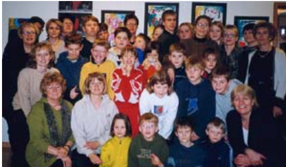
(Mynd: Nemendur og kennarar í Vesturhlíðarskóla 2000)

Ný lög um réttindi sjúklinga tóku gildi vorið 1997 og í þeim var heyrnarlausum í fyrsta sinn tryggð túlkun í heilbrigðisgeiranum með eftirfarandi grein: