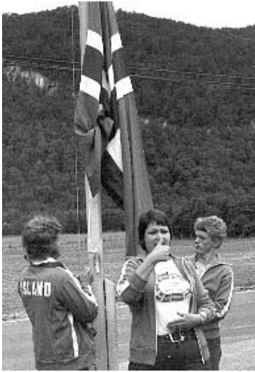
(Mynd: Frá Norænu æskulýðsmóti í Finnlandi 1972)

Á áttunda áratugnum var markmið félagsins það sama og við stofnun þess: að „stuðla að auknum félagsskap þeirra, sem mállitlir eða mállausir eru vegna heyrnarleysis og vinna að hagsmunamálum þeirra.“ Löggin höfðu haldist óbreytt frá stofnun félagsins og að mörgu leyti var það ekki búið að slíta barnsskónum. Félagsmenn voru óvanir stjórnarsetum og höfðu sumir ekki þá þekkingu sem þarf til þess að gegna því hlutverki. Félag heyrnarlausra hafði komið sér upp skrifstofu þar sem starfaði einn starfsmaður og sinnti hann ráðgjafajónustu fyrir heyrnarlausum í sambandi við tryggingamál, húsnæðismál, atvinnu, hjálpartæki og félagslega hjálp.